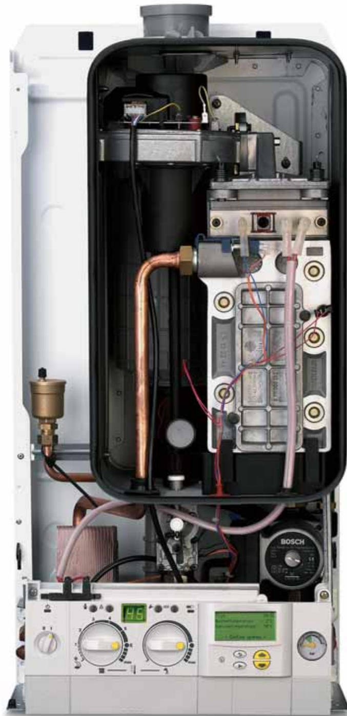
De binnenzijde van de Bosch 35 HRC Top

Achter de schermen van uw comfort speelt de techniek van Bosch een belangrijke rol. De hoogwaardige componenten staan borg voor betrouwbare, zuinige en gebruiksvriendelijke ketels. Ketels die jaren meegaan: na de introductie van een nieuwe ketel heeft Bosch nog minstens vijftien jaar alle onderdelen op voorraad!