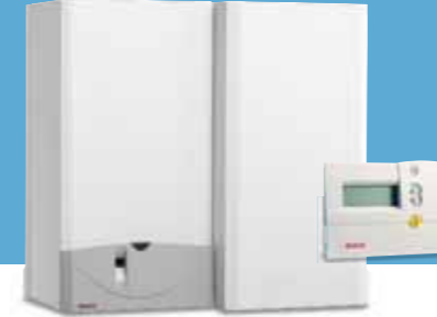
TURBO COMFORT SYSTEEM (incl. hangend voorraadsysteem)