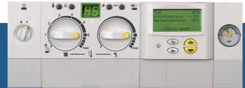
Tekstdisplay Heatronic HR-Top-ketel

Het omschakelventiel in de HR-ketels is ook weer zo'n unieke vinding van Bosch. Het ventiel is gemaakt van hoogwaardig composiet en zeer licht, waardoor het totale gewicht van de Bosch-ketels laag blijft. Daarnaast kan dit omschakelventiel zichzelf reinigen, zodat maar weinig onderhoud nodig is.